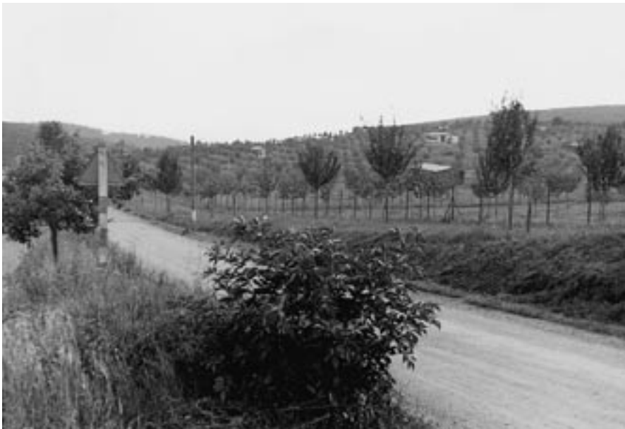
Cesta od Mokré Hory ke škole 1960