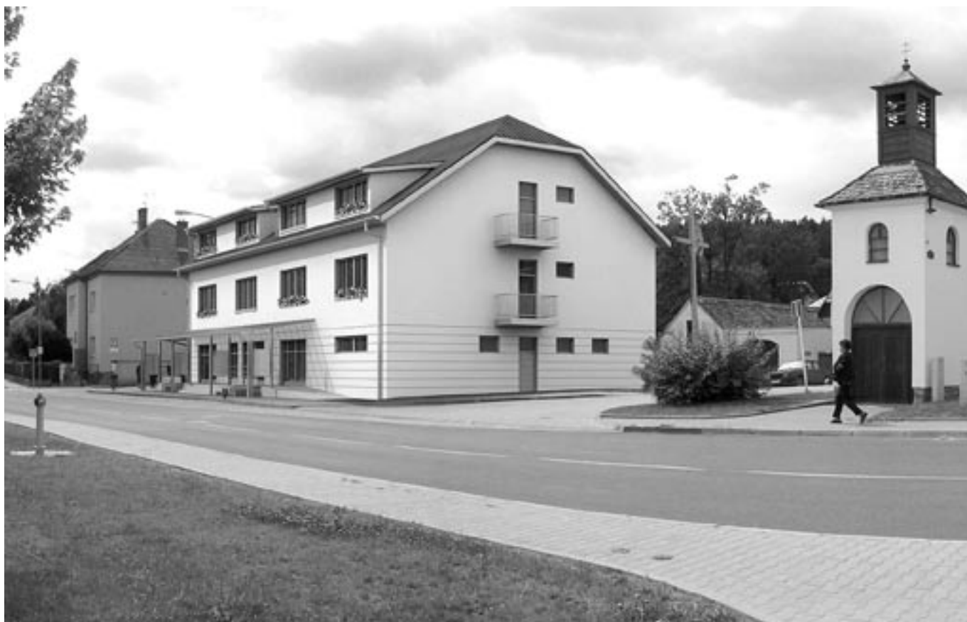
Dům s pečovatelskou službou Jehnice