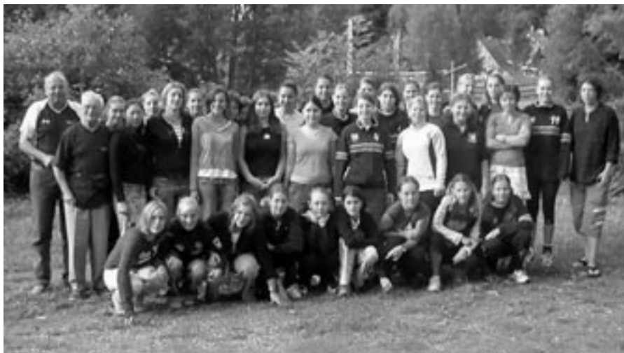
Společně v Horní Lipové

jsme si porozuměli. Ve druhé části soustředění, které se konalo v Jehnicích, bylo sehráno několik přátelských mezinárodních utkání. Pro naše kamarádky z Francie jsme pak připravili (kromě tréninku) prohlídku Brna a hradu Špilberk, návštěvu zámku ve Slavkově, a poslední den na Ranči Ch v Ořešíně ježdění na koních s opékáním selete (chutnalo všem), kterého se na naše pozvání