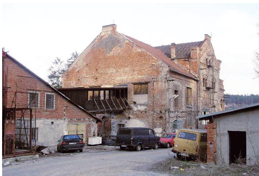
Budova pivovaru – pohled od Kleštíčku