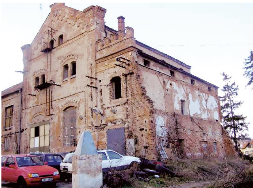
Budova pivovaru – pohled ze statku