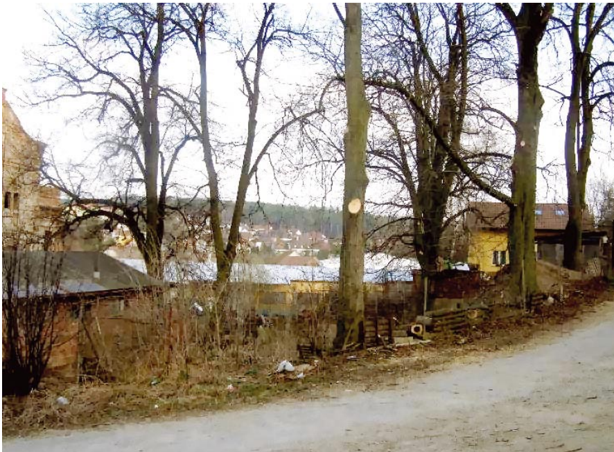
Kaštiny letní zahrádky pivovarské restaurace