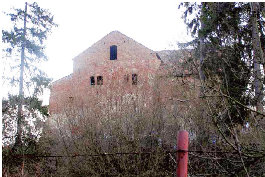
Budova pivovaru – pohled ze zámecké zahrady