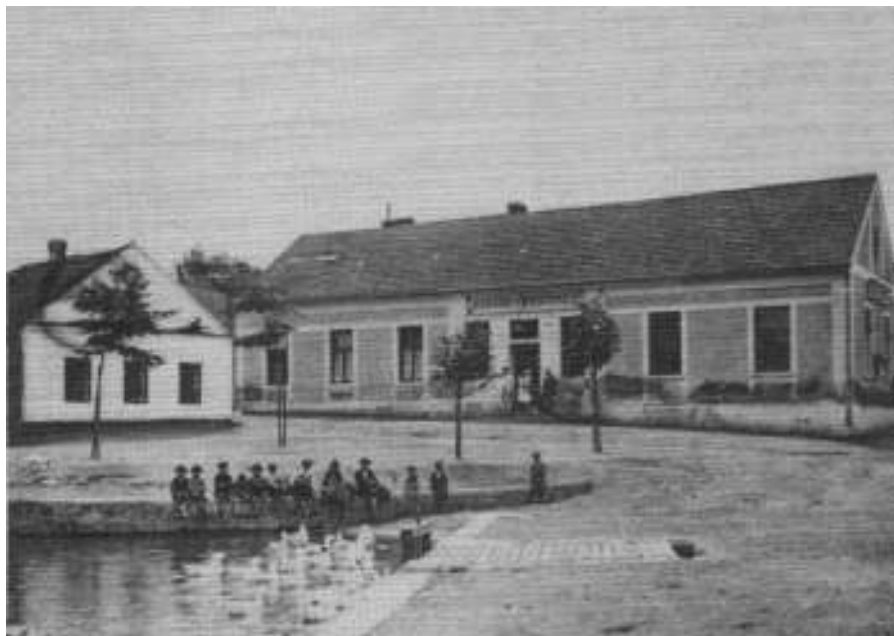
Obecní hostinec před r.1916