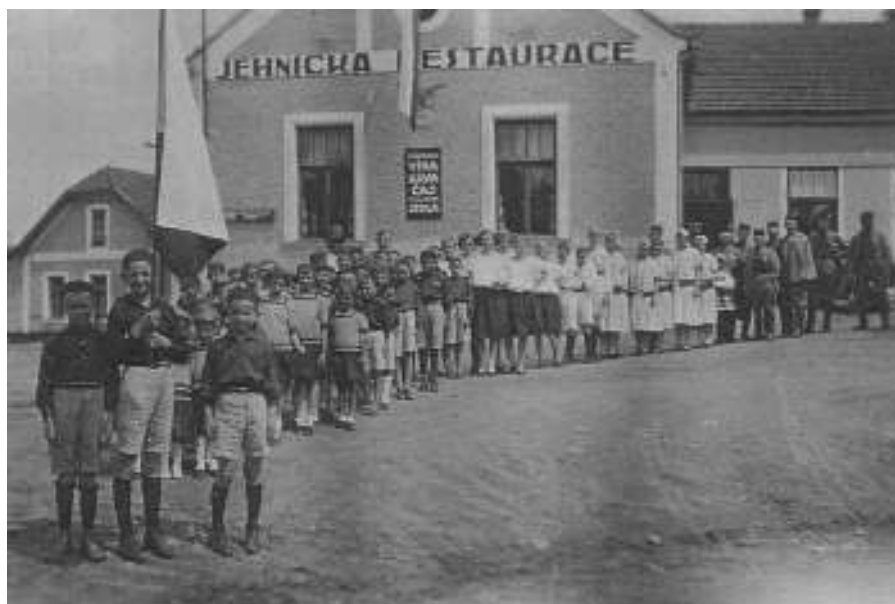
Průvod sokolů před obecním hostincem kolem r. 1938

Pokud chcete umístit svou reklamu nebo nabídku na stránkách tohoto tisku obraťte svůj požadavek na adresu redakce. Cena 10 Kč/cm 2 .