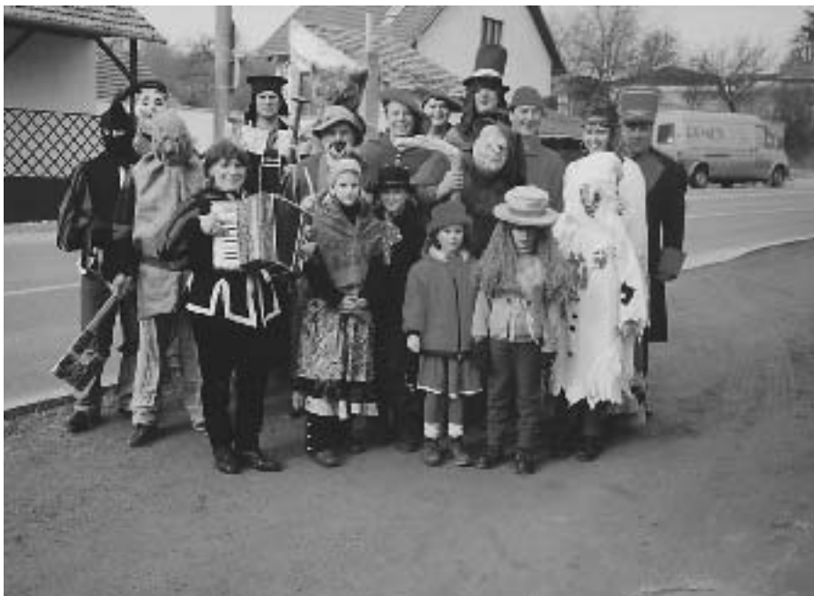
Ostatkový průvod masek

K.M. se dopustila přestupku dle §48 Zákona číslo 200/90Sb. O přestupcích ve smyslu článku 3, odst. 1, 2 a 3 Vyhlášky Statutárního města Brna č. 10/2001 k zabezpečení místních záležitostí veřejného pořádku ve městě Brně. Byla na místě poučena o přestupku i o tom, že se se psem musí