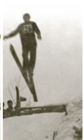
Skoky na lyžích – každý má svůj styl