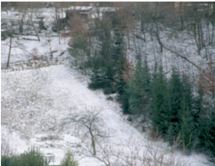
Zde býval Malý můstek – na Horce

Šest štafet mužů na 3 x 12 kilometrů překonalo i při prudkém větru trať celkem hladce; na prvním místě se umístila