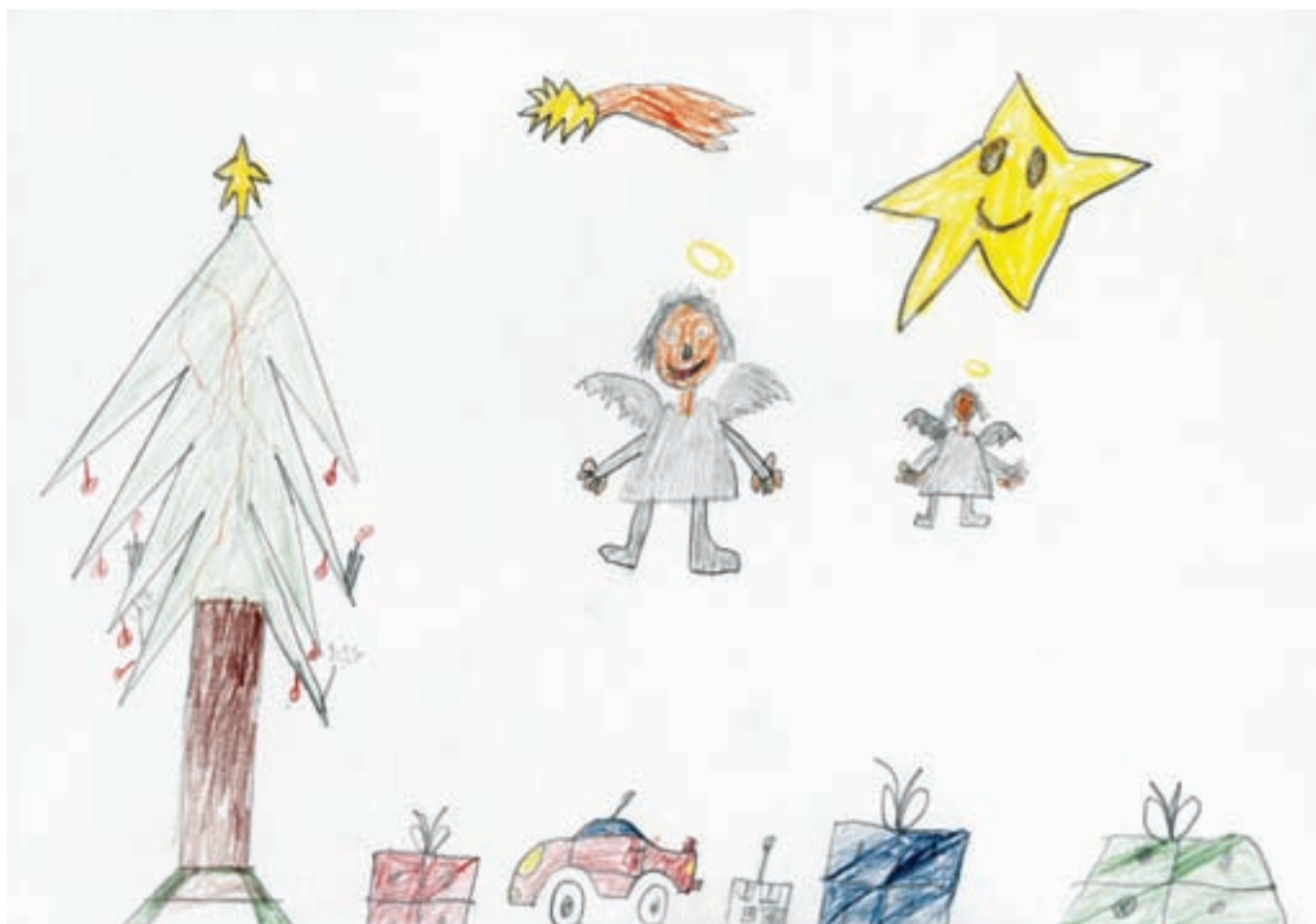
Autor: Patrik Janák 3. třída

Ziehzlinge“, což znamená doslovně tahací ocílka, správně česky škrabačka) a s tímto nástrojem mne začal škrabat, až můj povrch se stal pěkně ucelený, bez všech hran, které zůstaly po hoblování. Když pak provedl totéž se spodní deskou, odložil nás a začal se zabývat postranními destičkami, které nazýval „luby“. Ty luby měl člověk nařezány na slabé, tři centimetry vysoké, jedna a půl centimetrové destičky. Přetáhl je ciglinou a rozřezal na šest dílů, délka odpovídala mým spodním, středním a horním okrajům. K těmto lubům si člověk vyhobloval