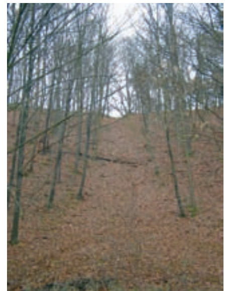
Velký můstek u jehnické zastávky