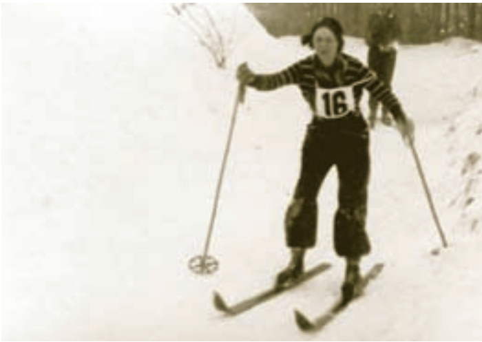
V zápalu boje

Závodů v sedmi kategoriích se účastnilo přes 100 závodníků a přihlíželo jim na 1 500 diváků.