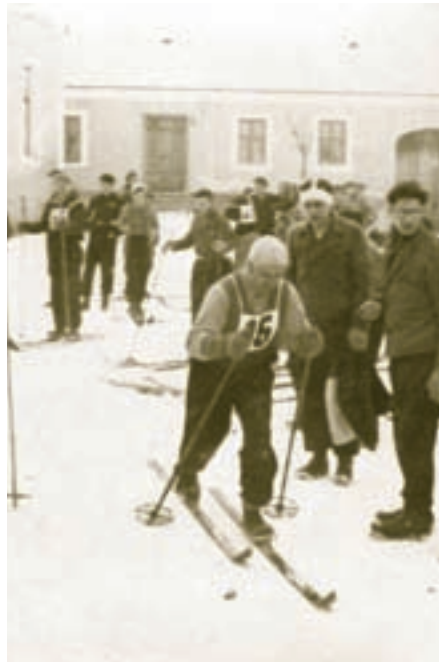
Start běhu na návoši