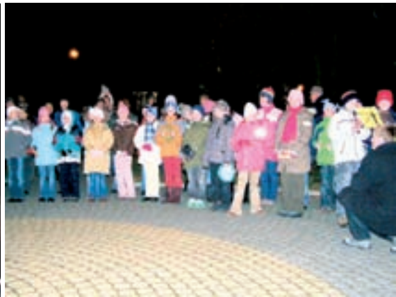
Vystoupení našich žáků