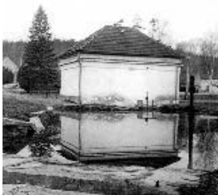
Pohled na hasičku zezadu, přes rybník – asi počátkem 80. let 20. století

potoka s betonovým dnem i stěnami, možnosti překrytí a jednoduchým oplocením. Také usneseno vysázeti na jaře 1929 podél upraveného potoka ovocné stromy a případně živý plot (z jehnické kroniky).