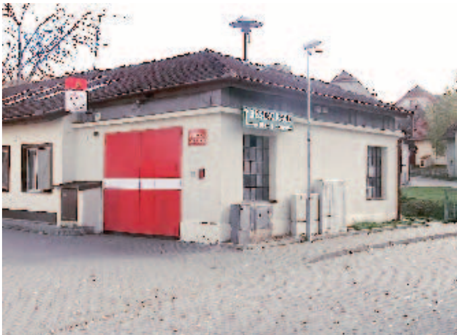
Současný pohled na hasičku začleněnou do obecního domu

Od května byla prováděna výměna elektrické sítě, do konce roku byla provedena výměna starých dřevěných sloupů za betonové a provedena montáž nového vedení.