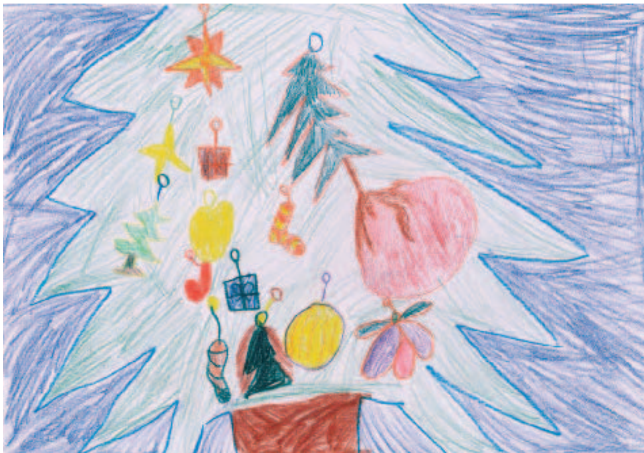
Autor: Maruška Kislingerová 1. třída

V současné době je největším želízem v ohni hráčka našeho klubu Kristína Ludíková, která úspěšně startuje na turnajích zařazených do