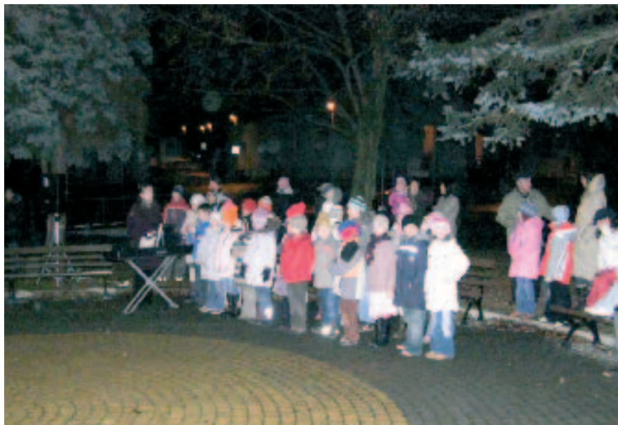
Děti naší školy