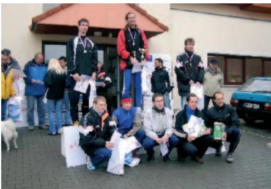
Běh o pohár Jehnic – běželi velcí