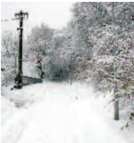
První sněž 11. 11. 2007 – ulice Meziboří

Tato již tradiční dobročinná akce je největší dobrovolnickou akcí v České republice.