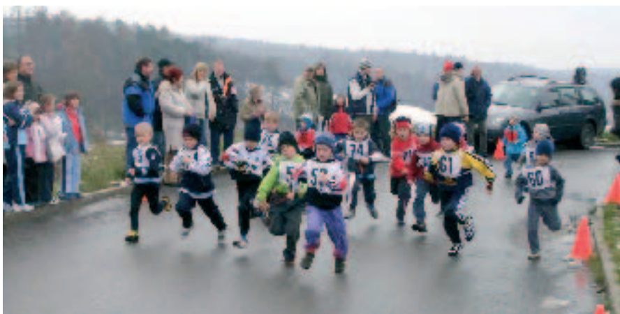
Běh o pohár Jehnic – běželi nejmenší