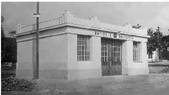
Původní hasička – brzy po dostavění v roce 1931