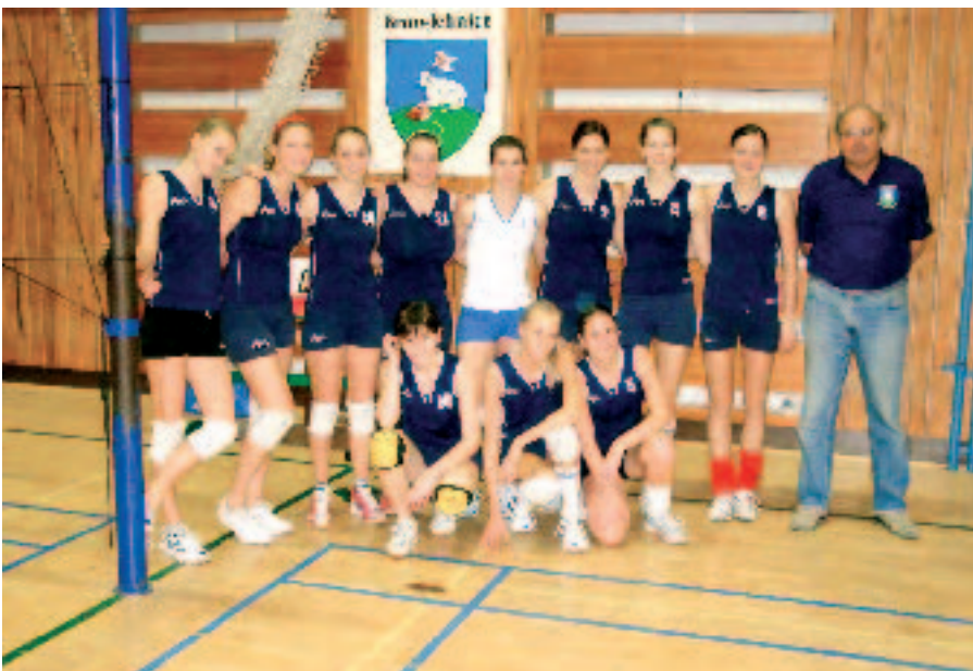
Družstvo juniorek TJ Sokol Jehnice

Letošní sezónu (2007/2008) jsme začali soustředěním většiny hráček zařazených do mládežnických družstev, které se konalo v srpnu 2007 v nádherném sportovním areálu v Bystrici nad Pernštejnem. Poté jsme pokračovali společnou přípravou s družstvem Sportovního gymnázia v Kaunasu (Litva) v Jehnicích. Do letošních mládežnických soutěží máme přihlášeno pouze jedno družstvo juniorek sestavené z děvčat různých věkových kategorií. Po kvalitní přípravě v měsíci září hrajeme krajský přebor juniorek a vedeme si v něm velmi úspěšně. Jsme zatím na 1. místě v naší skupině (v Jihomoravském kraji jsou celkem tři) a pokud ji vyhrájeme, budeme od ledna 2008 bojovat ve finálové skupině o postup do kvalifikace na 1. ligu. Většina těchto děvčat je z Jehnic a prošla přípravou již od přípravek přes žákyně.