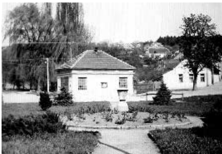
Hasička po úpravách střechy a vchodu – asi z roku 1966 – pohled z nově založeného parku