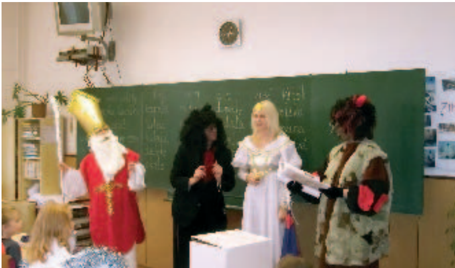
Mikuláš v naší základní škole

Rád bych prostřednictvím Jehnických listů poděkoval všem našim členům Základní organizace svazu chovatelů v Jehnicích za jejich úspěšnou chovatelskou činnost v letošním roce.