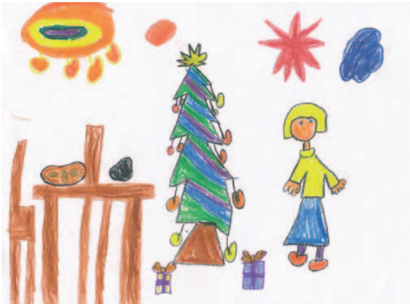
Autor: Veronika Škarecká 1. třída

Další nastupující generace trénuje v přípravce, aby mohla ty úspěšné nahradit. Jsou to děvčata ročníků 1993-96 a pravidelně trénujeme úterý a čtvrtek od 16:00 hodin v tělocvičně místní základní školy. Velmi rádi tam další děvčata přivítáme."