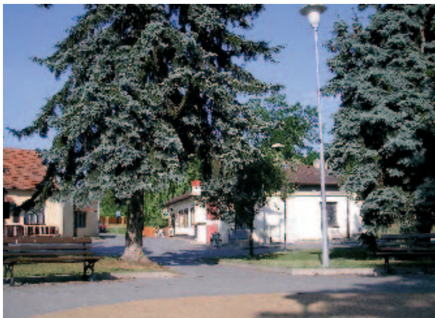
Současný pohled na obecní dům s hasičkou

Plánovaná regulace potoka přes náves nebyla provedena, potok byl vyčištěn pouze brigádnicky.