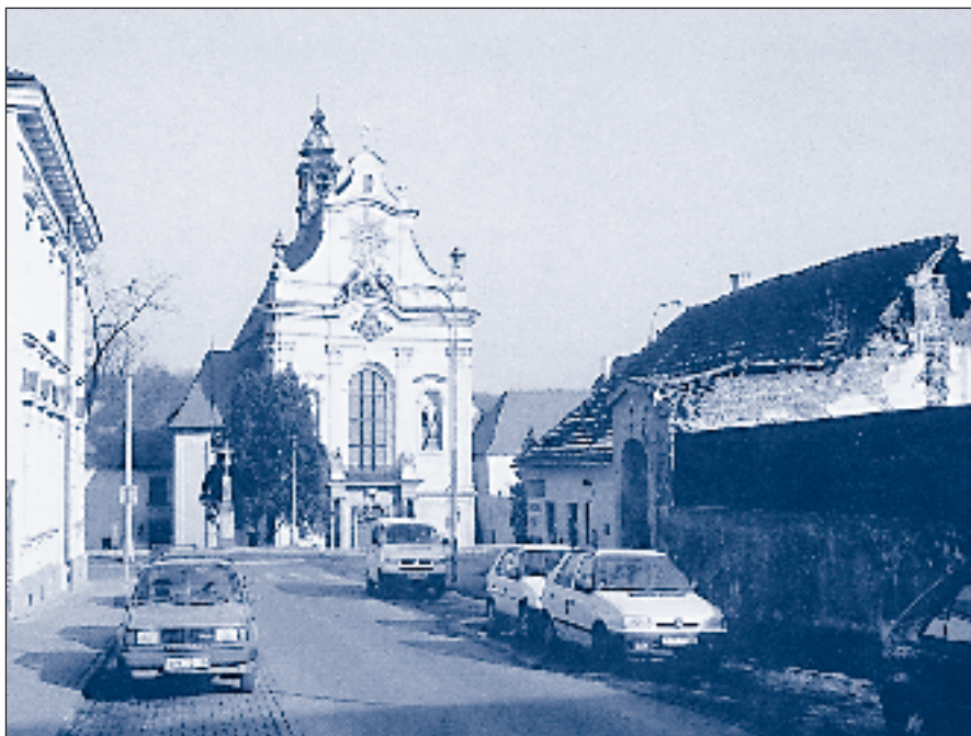
Jehnická restaurace na Metodějově ulici 1935 a dnes