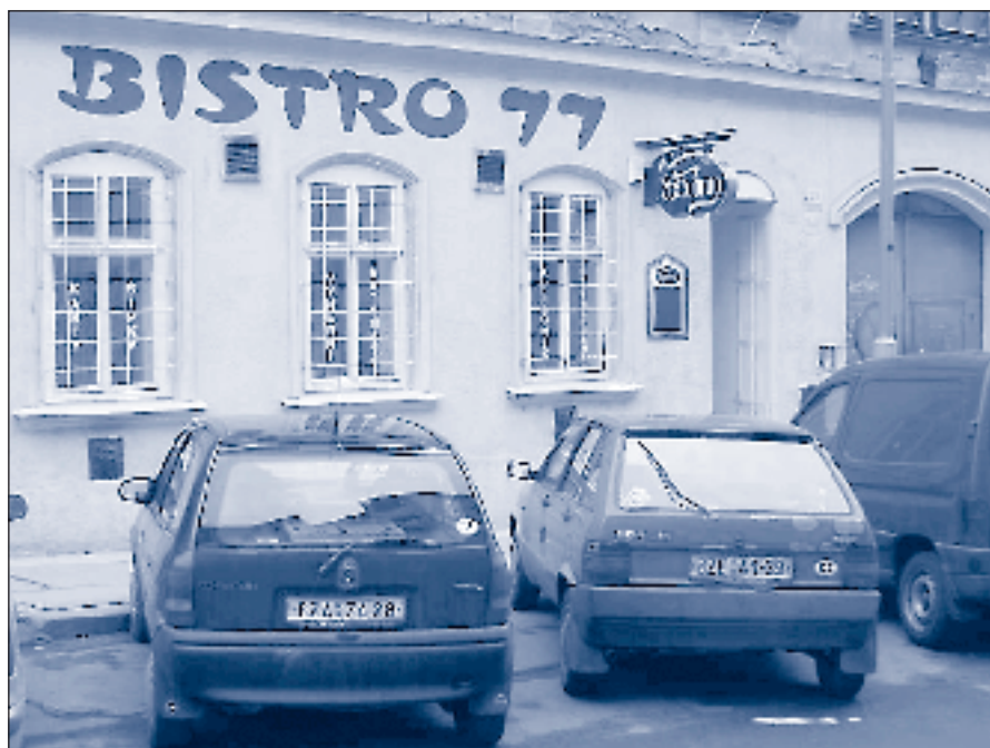
Jehnický restaurant - ulice Františka Josefa v roce 1904 a tentýž objekt dnes

Také v dolní části ulice Orlí byla pivnice jehnického pivovaru. O té však pamětník starých časů prohlašoval, že ze svého někdejšího lesku a nimbů už mnohé ztratila.