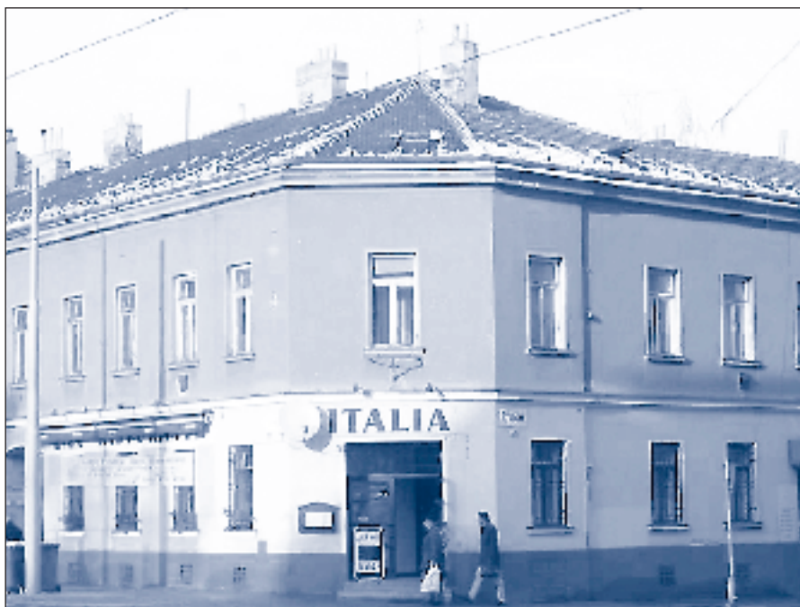
Jehnická pivnice na ulici Rybníček počátek 20. století a dnes