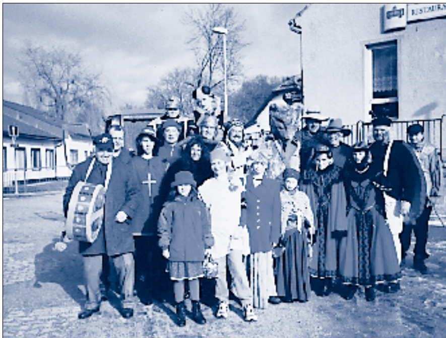
Průvod masek při tradičních ostatkách

Poukázky vyplňujte hůlkovým písmem, čitelně a nezapomeňte uvádět zejména variabilní symbol (rodné číslo poplatníka).