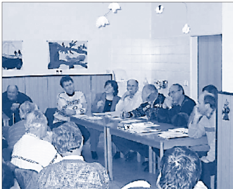
Veřejné setkání s občany